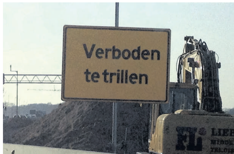
Foto, gemaakt langs snelweg A12 bij Utrecht. Wie weet wat dit bord betekent, kan een tweet sturen: @NRCMensen.

In deze rubriek staan foto's waarop de sporen van de mens in de publieke ruimte op een originele manier zichtbaar zijn gemaakt: in afbeeldingen, teksten, verrassende uitingen van kunst. Stuur uw foto plus toelichting naar mensen@nrc.nl. Op nrc.nl/mensen lichten we toe welke beelden we zoeken.